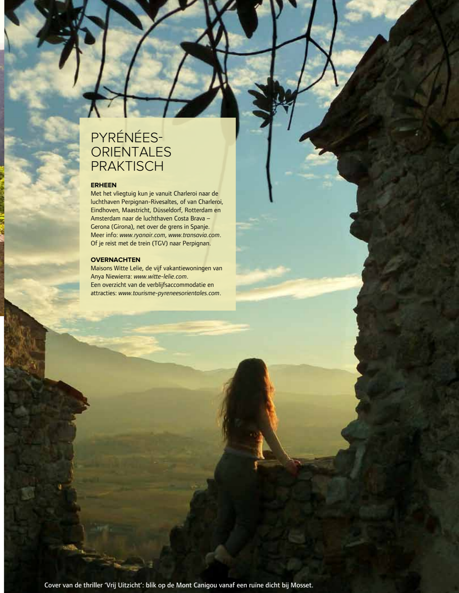
Cover van de thriller ‘Vrij Uitzicht’: blik op de Mont Canigou vanaf een ruïne dicht bij Mosset.