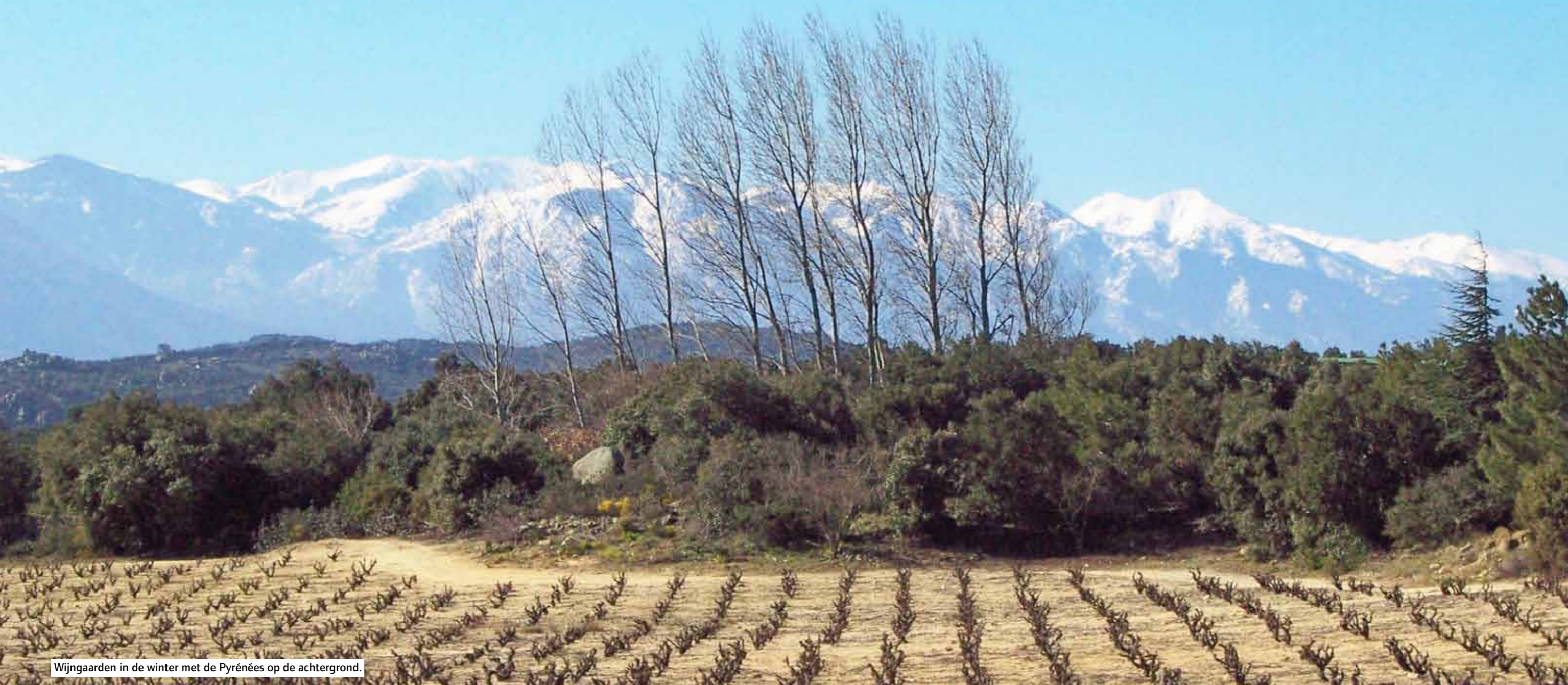
Wijngaarden in de winter met de Pyrénées op de achtergrond.