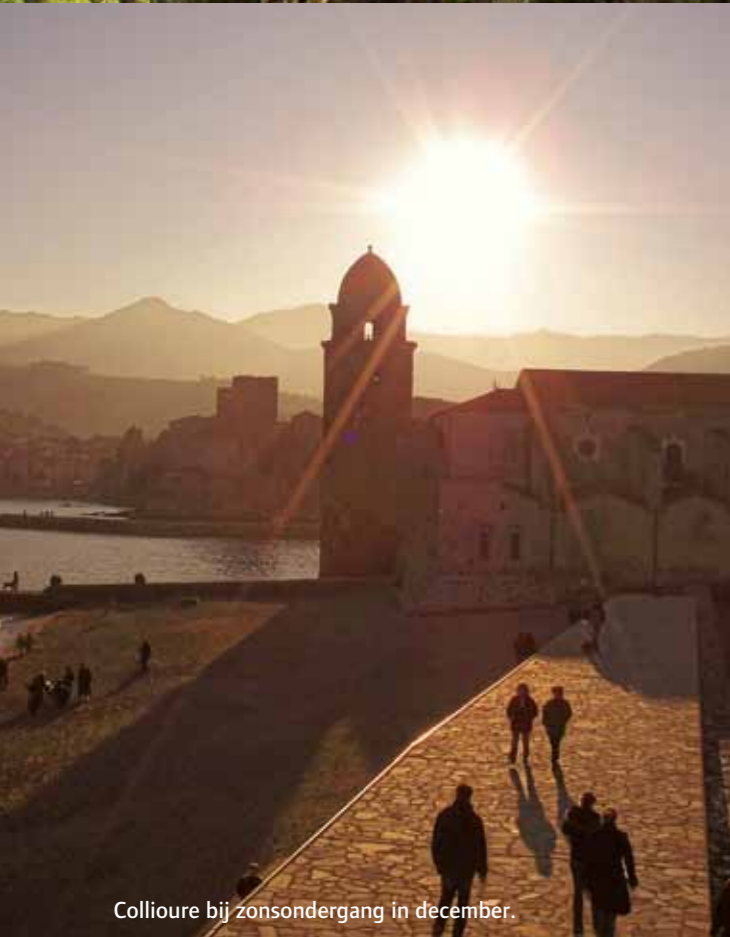
Collioure bij zonsondergang in december.

belangrijke momenten. Zo ontmoet het hoofdpersonage Tess haar geliefde aan een rivier en wanneer het haar te veel wordt, trekt ze naar zee om uit te waaien. En ze is verzot op badderen in het thermale openluchtbad van St.-Thomas. “Omdat ik zelf ook dol ben op het warme zwavelhoudende water dat op diverse plaatsen opborrelt, besloot ik om een cruciaal hoofdstuk hier te situeren.”