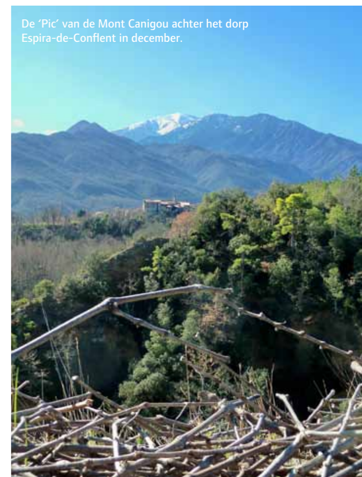
De 'Pic' van de Mont Canigou achter het dorp Espira-de-Conflet in december.