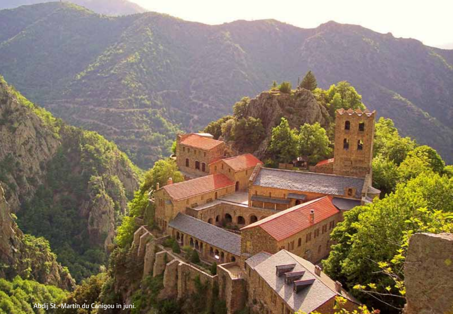
Abdij St.-Martin du Canigou in juni.