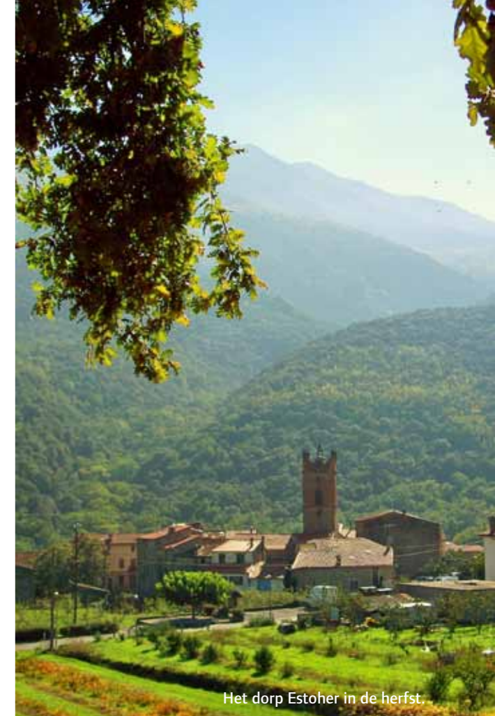
Het dorp Estoher in de herfst.