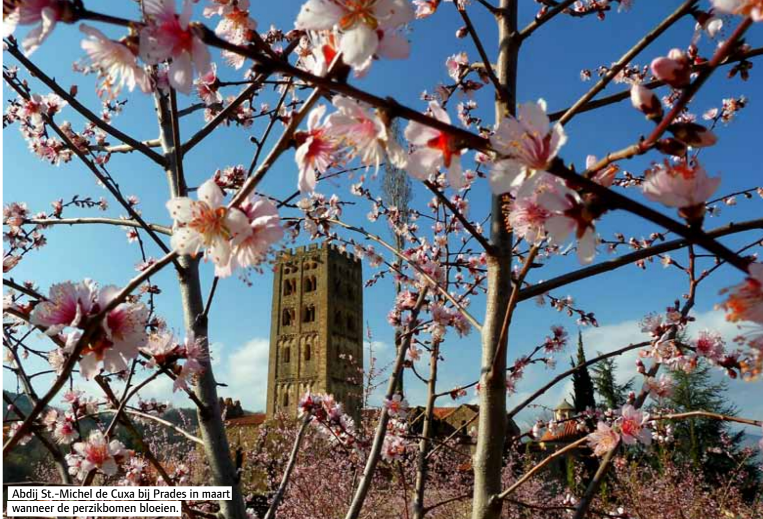
Abdij St.-Michel de Cuxa bij Prades in maart wanneer de perzikbomen bloeien.