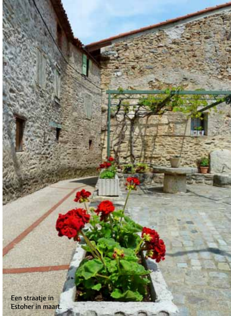
Een straatje in Estoher in maart.