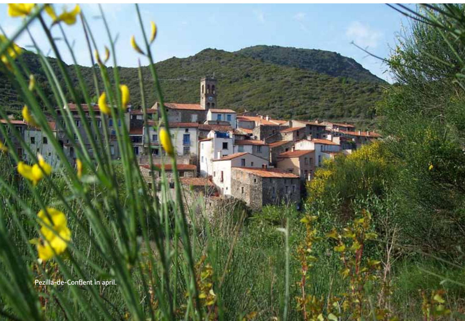
Pezilla-de-Conflet in april.

weer een nieuwe identiteit accepteren. Tegelijkertijd kregen ze de kans om het beste van iedere overheerser over te nemen. Dat zie je ook in Frans-Catalonië. Het gebied vormde de toegangspoort tot ofwel Spanje, ofwel Frankrijk. Tijdens mijn zoektocht naar informatie groeide mijn band met de Pyrénées-Orientales. Zo leerde ik dat de regio al tijdens de prehistorie bewoond werd. Een van de oudste Europeanen werd hier gevonden, in de heuvels boven Tautavel. Ook de Romeinen lieten hun sporen na. Vooral de romaanse kerken en abdijen zijn internationaal bekend. Mijn persoonlijke favoriet is de abdij Saint-Martin-du-Canigou, boven op een rots omringd door hoge bergtoppen. Tijdens een bezoek kwam ik op het idee om een onbekende die vanuit het château van Mosset de omgeving bespiedt, te verwerken in het verhaal. Ik maak overigens ook een knipoog naar het fauvisme, dat aan de kust tot bloei kwam."