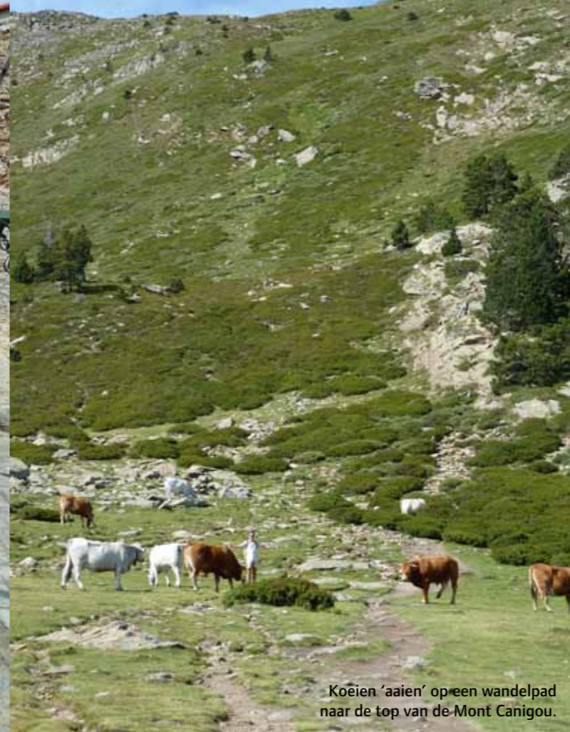
Koeien 'aaïen' op een wandelpad naar de top van de Mont Canigou.