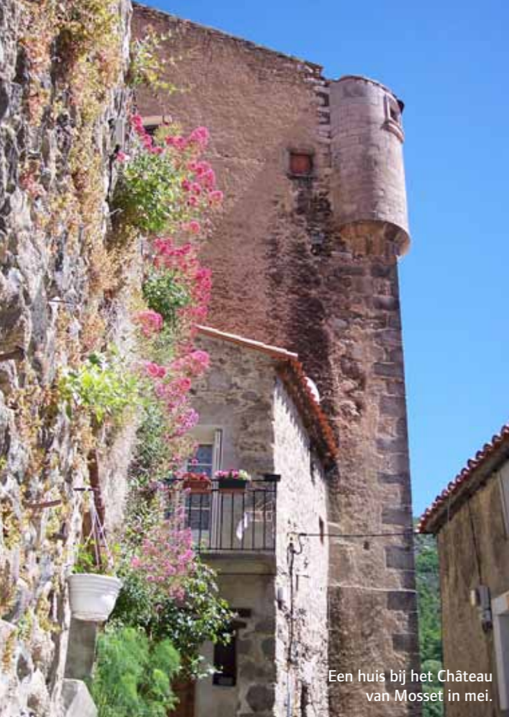
Een huis bij het Château van Mosset in mei.