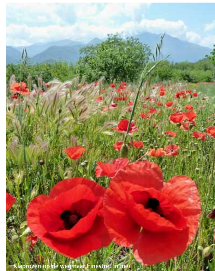
Klaprozen op de weg naar Finestret in mei.